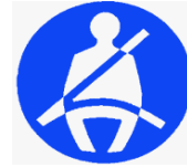
Figura 18. Article 29. Distintiu de cinturó de seguretat